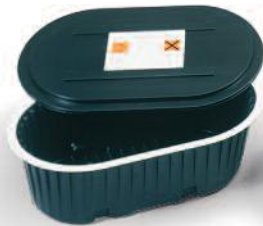
Kapaklı bertaraf teknesi