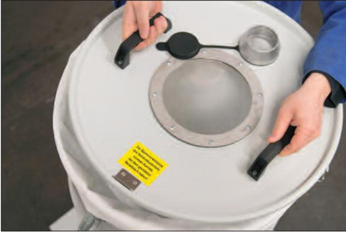
Kapağı kaldırarak kolayca filtre değişimi