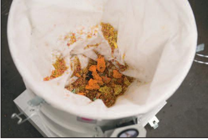
Keçe torbada kesme kalıntılarını toplama

DAV-SB serisi endüstriyel emiciler üretim tesislerinde hem lif döküntülerinin hem de kesme kalıntılarını (örn. kağıt, plastik, kumaş) emmek için kullanılabilir. Emme gücü, tasarımı ve ölçüleri yerleştirildiği üretim makinelerinin gereksinimlerine uyarlanmıştır. Kesme kalıntıları emilir ve toz sınıfı M filtre torbasında toplanır. Böylece toplanan malzeme filtrenin hacmini en iyi şekilde kullanabilmek için iyice sıkıştırılır. Doldurulan filtre emiciden kolayca çıkarılabilir.